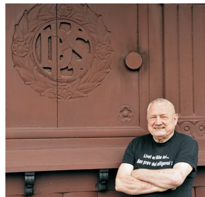
Den 119 år gamle træbygning er særdeles velbevaret og rummer mange fine skønvirkedetaljer. Bogstaverne DKS i laurbærkransen er forkortelsen for 'De københavnske Sporveje'.

Min hustru Dölma kommer fra Axu i Østt Tibet. Mens hun var spæd flygtede familien til Indien, en rejse på 5 år. Hun gik i skole i Dardjeeling. Da skolen var forbi, blev hun gift med en dansker. De slog sin ned i København og fik to børn. Efter 7 år blev de skilt. Hun var så enlig mor i mange år.