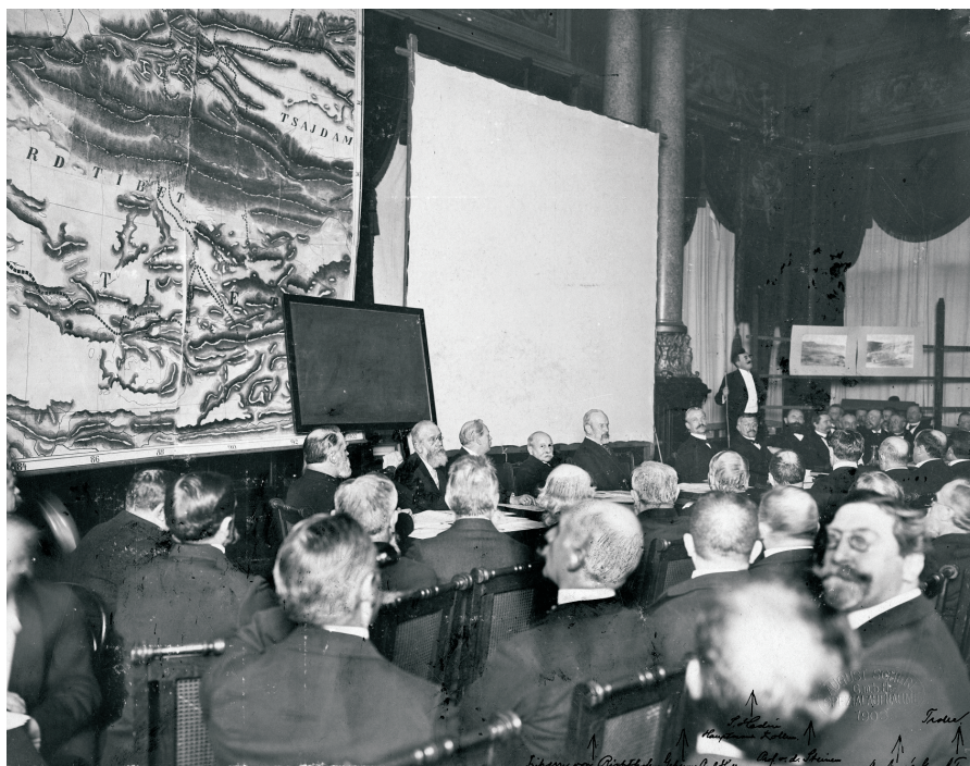
Sven Hedin holder foredrag for Ferdinand von Richthofen og 'Gesellschaft für Erdkunde' i Berlin, 6. feb. 1903.