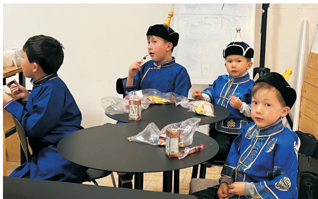
Den yngste generation var rigt repræsenteret ved festen og fulgte opmærksomt med i begivenhederne.

dyrt at udsende og producere et trykt blad, samt at udgifterne til porto stiger løbende. På workshopen i februar 2022 blev medlemsbladet fremhævet som et af de største aktiver i selskabet. Forsamlingen tilkendegav en stor opbakning til produktionen af medlemsbladet.