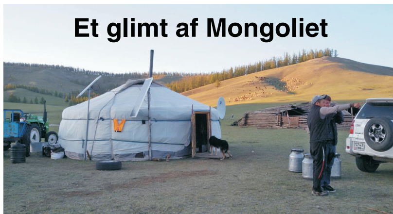
Glimt af 'Danskerbyen', som Kronprins Frederik har besøgt et par gange og som er byen på Zobelstletten, hvor foredragsholderne bor i perioder.

Uddrag fra Mongolische Chronik januar-marts 2022 udsendt af Deutsch-Mongolische Gesellschaft e.V.