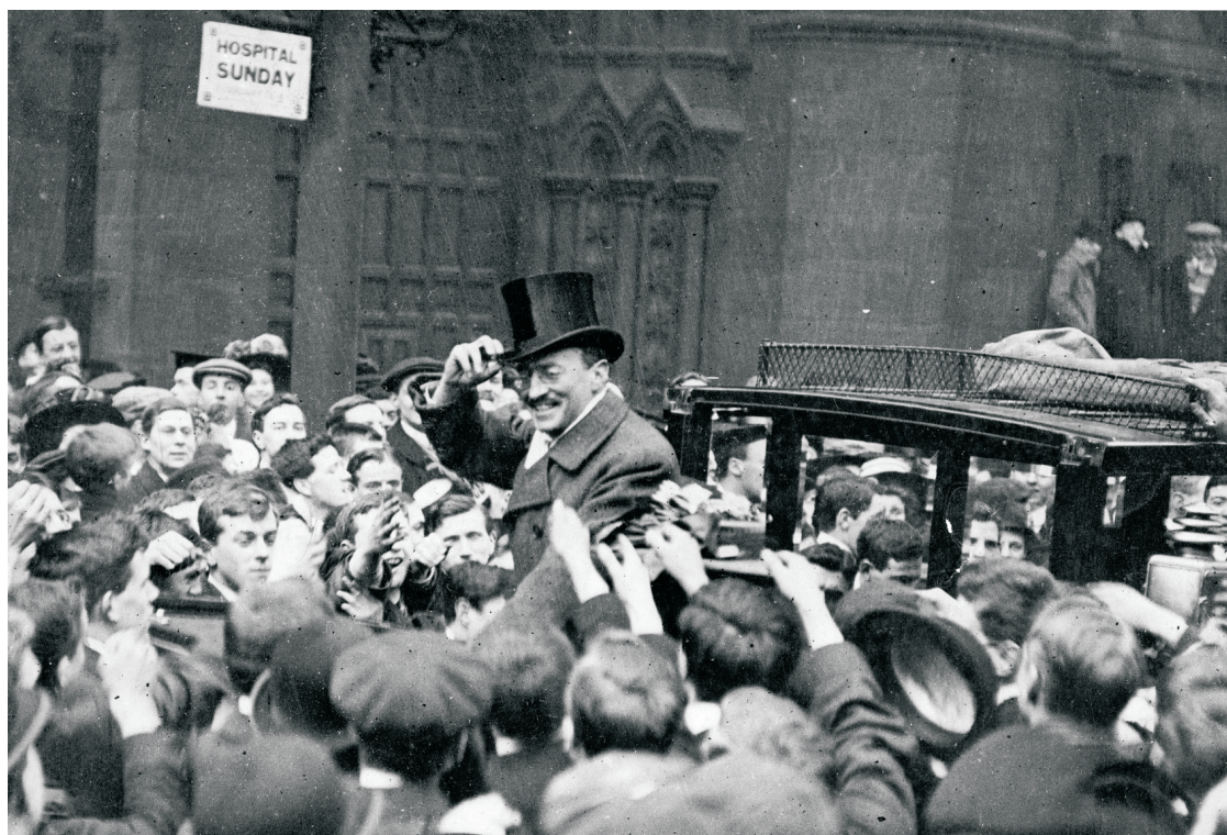
Sven Hedin bæres i triumf på studenternes skuldre ved ankomsten til universitetet i Manchester, 13. feb. 1909.

den 14. november at holde et foredrag for Det Kejserslige Russiske Geografiske Selskab.