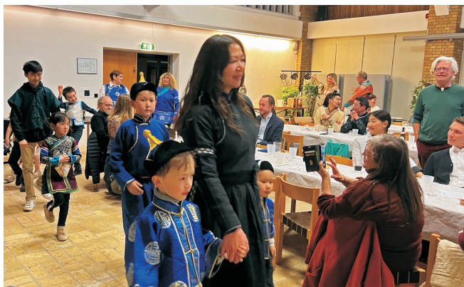
Deltagerne i aftenens konkurrence om den flotteste dell gik catwalk omkring langbordene.