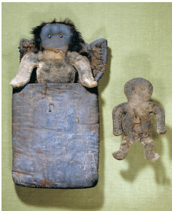
To fildukker. Den blåøjede står foran sin 'sovepose'. Den rødøjede har tre strimler stof hængende fra sin navle. Begge dukker synes ikke at have hverken næse eller mund. De repræsenterer hjælpeånder eller husguder, her forstået som forfædre. Også almindelige mongoler, ikke kun shamaner, ville have sådanne fildukker på deres husalter.