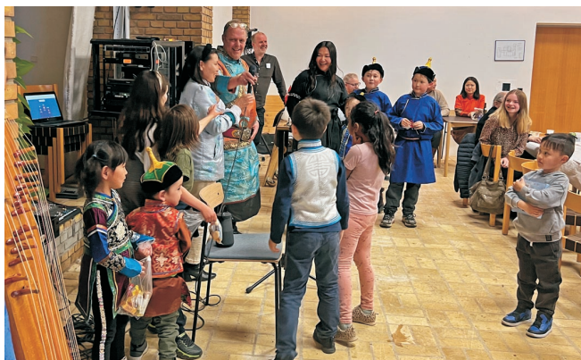
Efter 'modeshowet' var der uddeling af præmier til både voksne og børn.