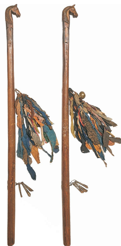
Dette par hestestave er ikke Pu-vuas, men de ligner hendes. De er anskaffet ved klosteret Ullan Tolgoi'in Sum, i Gulchagan-distriktet i Chahar, 9. maj 1939. Øverst ser man det udskårne hestehoved. Midt på hænger nogle stykker stof, hvortil der er fæstnet nogle bronzer. Her ses dele af en hængelås. Nedenunder ses en metalring med tre metalstykker, som er 'nøgler' til andre verdener. Hestestavene er 93 cm lange. De kaldes 'Boge'in Homori'.

Otoron var en gammel kvinde og krøbling. Hendes ben var lamme, og også hænderne var deforme og kloagtige. Måske skyldtes det leddegigt. Da jeg kom ind i teltet, sad hun på gulvet midt for den teltvæg, der lå til venstre