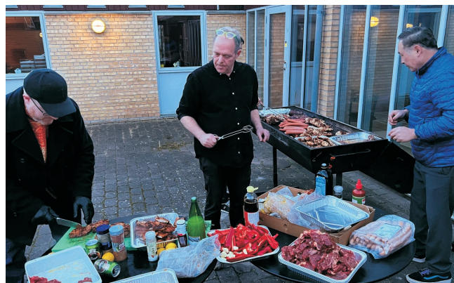
Aftenens menu bestod af en bred vifte af kødvarer tilberedt over de glødende grillkul af de tre mesterkokke.